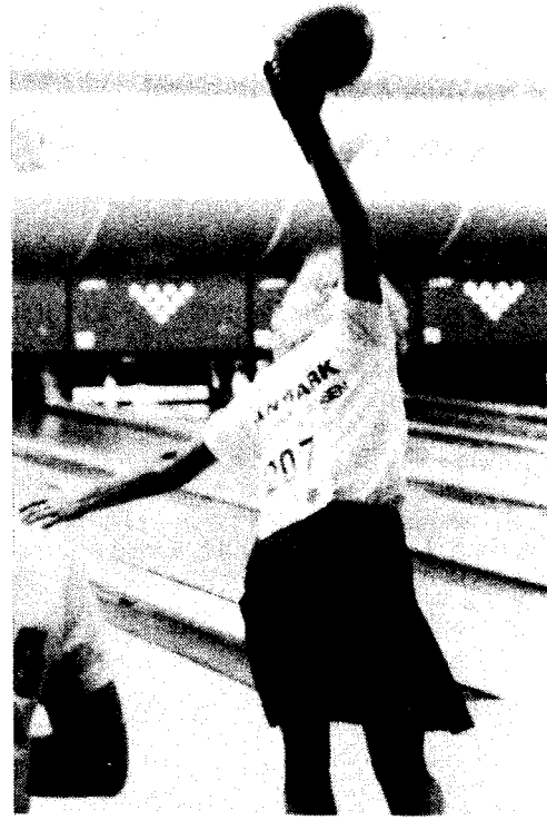
L'incroyable « back swing » de la Danoise

En match de classement, le Suisse, gaucher, attaque sur un triplé contre split (4/9), spare, split (4/6/10) pour le Français qui trouve, encore un split à la 9 e (5/7), 179 à fond et 191 pour l'Helvétie. Lors de la retransmission télévisée de la finale française à Avignon, Philippe Dubois avait dit : « Je serai au moins dans les 5 premiers ». Il a tenu parole. Ensuite le Formosan élimine le Suisse 199/176, puis le Thaïlandais (au cours d'un match passionnant) 233/214. Enfin pour le ti-