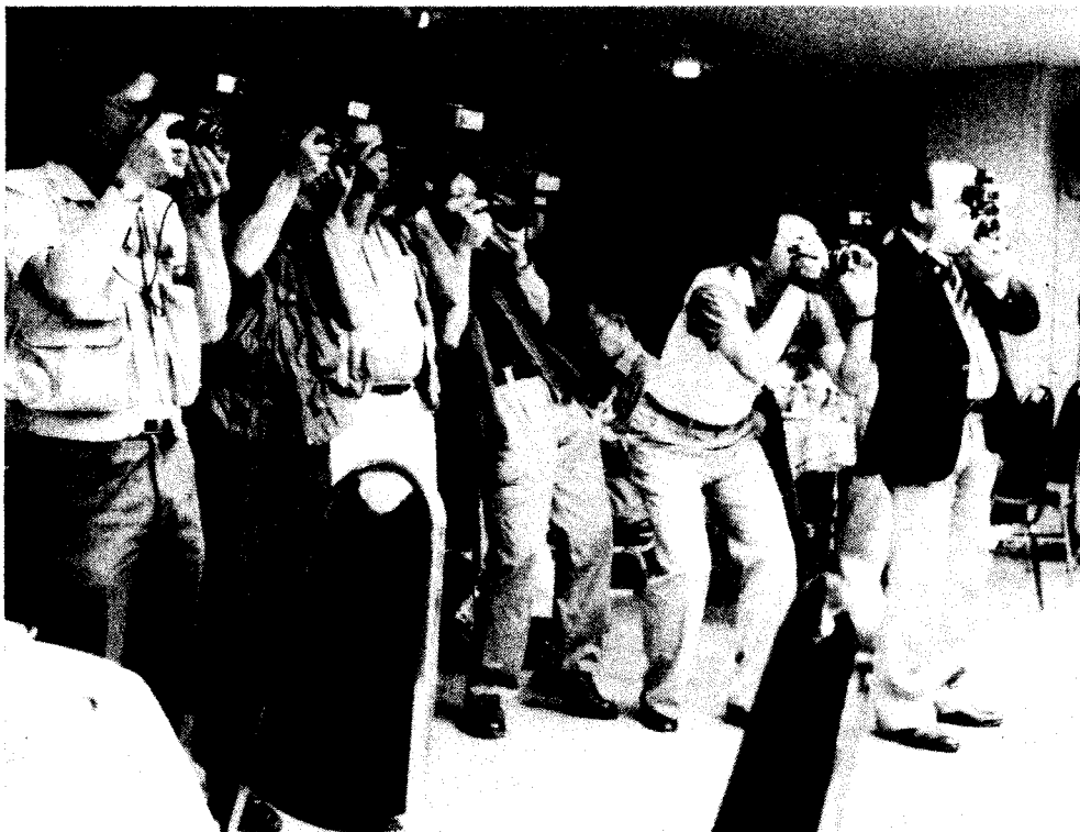
La couverture médiatique était très importante